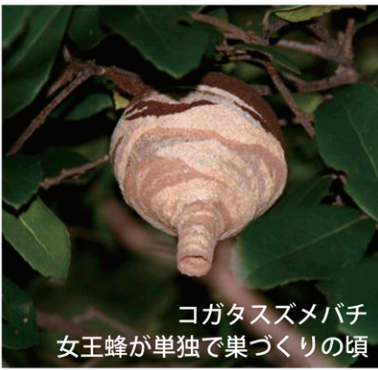
コガタズメバチ 女王蜂が単独で巣づくりの頃