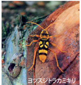
ヨツシトラカミキリ