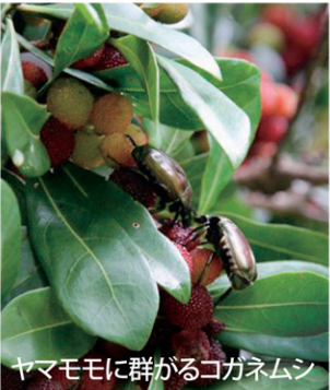
ヤマモモに群がるコガネムシ